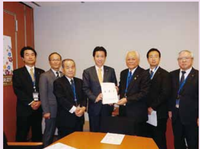
長峯誠参議院議員への要望の様子