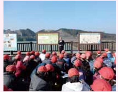
ダムの説明を聞く児童達の様子

※水土里ネット大淀川右岸が管理する、「天神ダム」の周辺には景観の保全並びに水源のかん養を図ることを目的に、約 1,000 本の“さくら”が植栽されている。