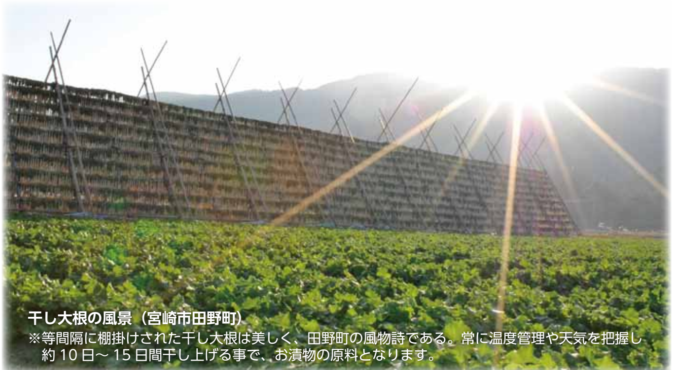
干し大根の風景 (宮崎市田野町)

※等間隔に棚掛けされた干し大根は美しく、田野町の風物詩である。常に温度管理や天気を把握し約 10 日～ 15 日間干し上げる事で、お漬物の原料となります。